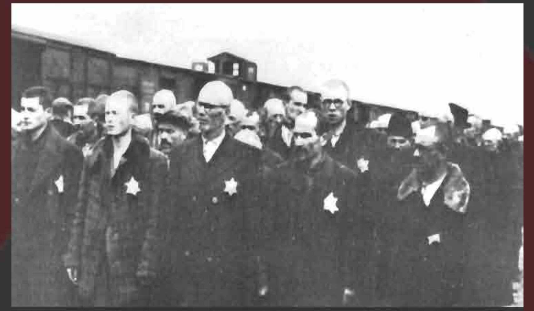
Slovakian Jewish men selected for labor upon arrival in June 1944.

With the introduction of Zyklon Bat Auschwitz-Birkenau and Majdanek, death became a diabolical industry. This more efficient method rapidly spread to the other killing centers.