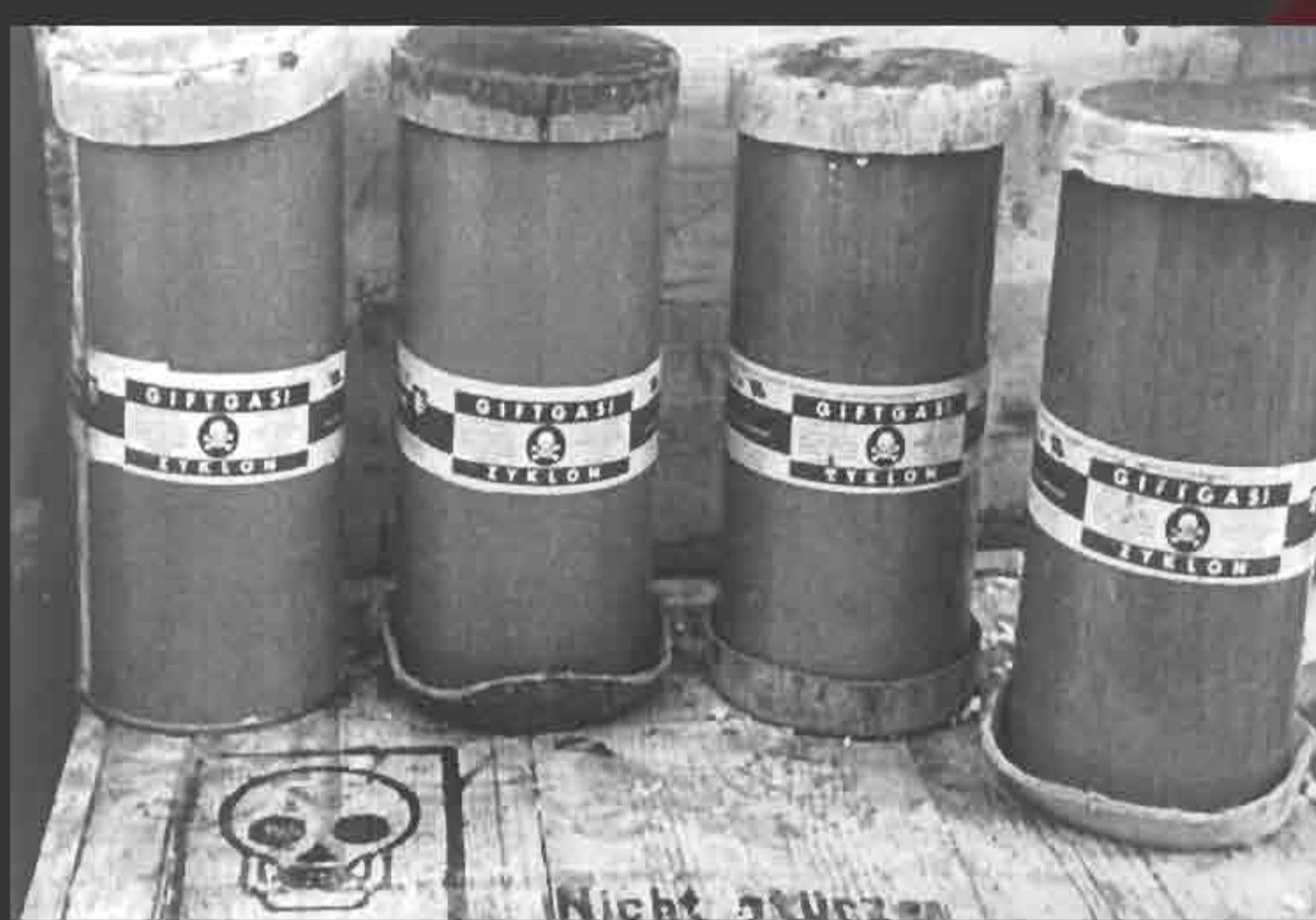
Containers of Zyklon-B pellets, a form of crystalline prussic acid, used to gas inmates at Auschwitz.

“Final Solution” in 1941, it became the largest center for the murder of millions of European Jews.