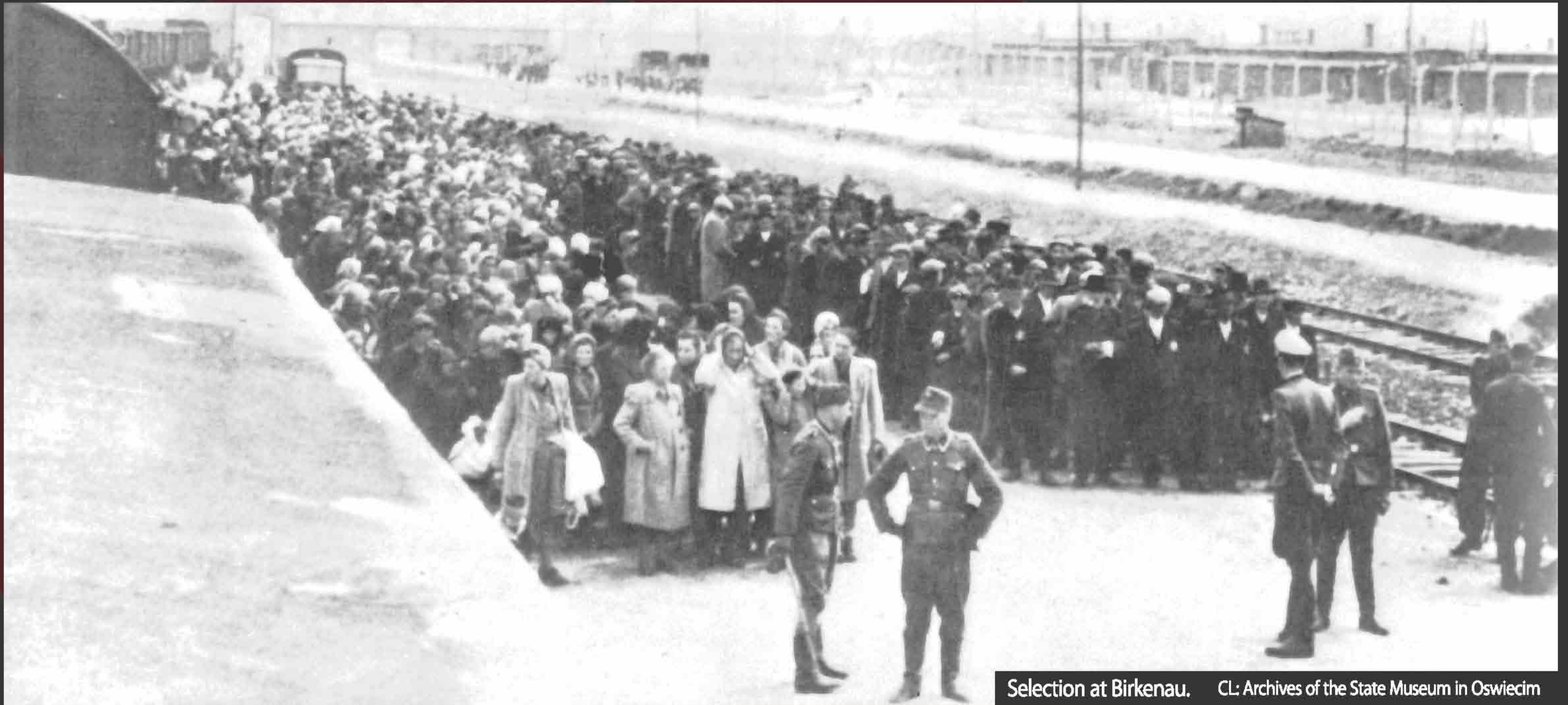
Selection at Birkenau.

เอาชีวิทซ์-เบอร์เคอเนา เป็นค่ายนาซีที่ใหญ่ที่สุด ตั้งอยู่ที่อูเปออร์ ซิเลเชีย (Upper Silesia) ในประเทศโปแลนด์ เป็นทั้งค่ายกักกันและศูนย์สังหารหมู่ เดิมสร้างขึ้นเพื่อขังชาวยิวโปแลนด์ แต่ขยายขอบเขตออกไปเมื่อนาซีเริ่มโครงการ “การแก้ปัญหาสุดท้าย” เมื่อ พ.ศ. 2484 ชาวยิวในยุโรปถูกส่งมาสู่โรงฆ่าที่นี้หลายล้านคน เบอร์เคอเนา เป็นที่กักกันผู้หญิงและชาวยิวที่ไม่ในวิหิต ค่ายเล็กในเอาชีวิทซ์ ใช้สำหรับนักโทษชายที่ทำงานเป็นทาส การสังหารกลายเป็นอุตสาหกรรมอันทรงประสิทธิภาพ เมื่อมีการนำสารพิษซิคคอน เบ (Zyklon B) มาใช้โดยมีผลเป็นที่น่าพอใจ และถูกส่งไปใช้ที่โรงฆ่าอื่นๆ อย่างรวดเร็ว “ได้นำซิคคอน เบ ซึ่งเป็นผลึกของกรดพรุสซิค (prussic) มาใช้ที่เอาชีวิทซ์ โดยโปรยลงไปในห้องประหารจากช่องเล็กๆ ใช้เวลาประมาณ 3 ถึง 15 นาที กว่าจะฆ่าคนในห้องหมด ทั้งนี้ขึ้นอยู่กับสภาพอากาศ เราทราบว่าคุณตายหมดแล้วเมื่อหมดเสียงร้อง” รูดอล์ฟ เฮิสซ์ (Rudolf Hoess) บันทึกที่นูเรมเบิร์ก (Nuremberg)