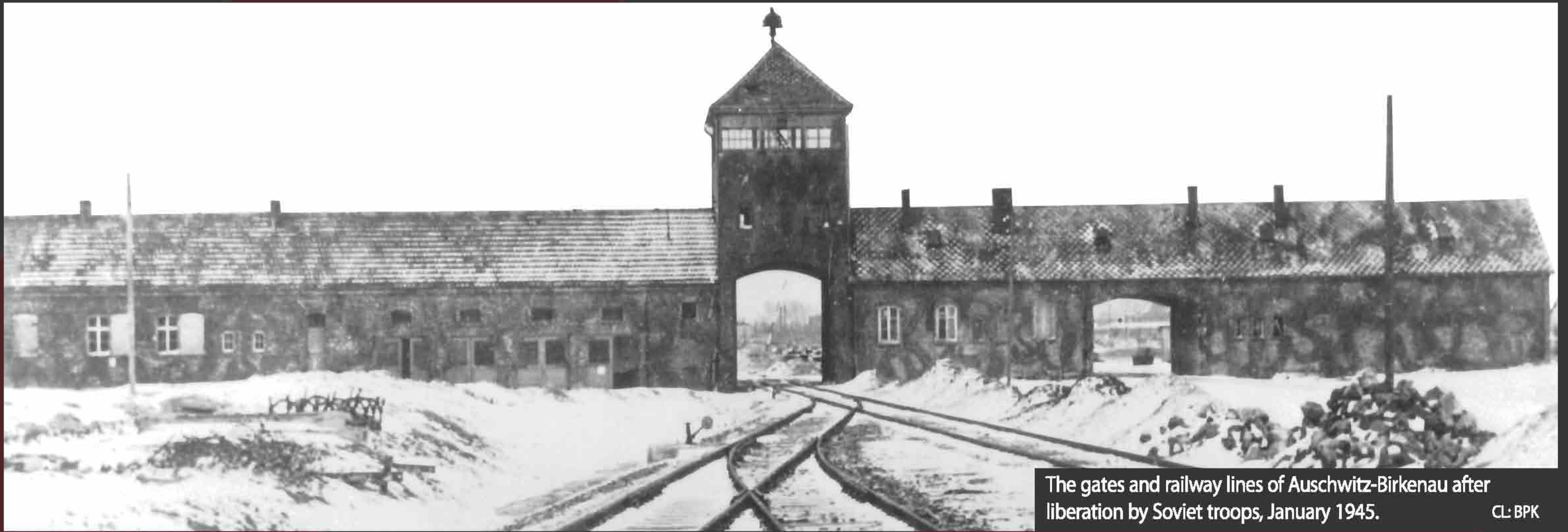
The gates and railway lines of Auschwitz-Birkenau after liberation by Soviet troops, January 1945.

“At Auschwitz, I used Zyklon B, which was a crystallized prussic acid which we dropped into the death chamber from a small opening. It took from 3 to 15 minutes to kill the people in the death chamber, depending on the climactic conditions. We knew the people were dead because their screaming stopped.”